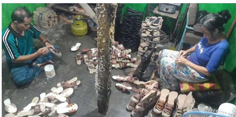
图为周二（31/5），在西瓜哇省打璜（Tasikmalaya）市 Mangkubumi 区的工人正在制造女士凉鞋的情景。

根据印尼鞋工业协会（Aprisindo）数据，鞋业在 2021 年的出口额为 87.4 兆盾，同比增长 28%。政府定下指标，到 2024 年，每年将对皮革和鞋子行业进行 21.7 兆盾的投资。