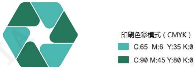
图1 安检锁专用标识图样